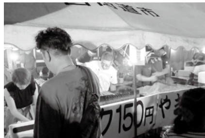
8月に開催された四街道ふるさとまつりにて

青年部全員が大きな声を出し、呼び込みをし、精一杯汗を流し、お客様も含めてたくさん笑顔を見ることができました。