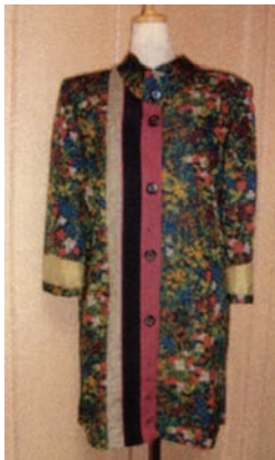
配色を生かしたロングコート