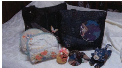
端切れから多くの小物に!