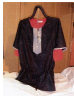
羽織りからチェニックに!