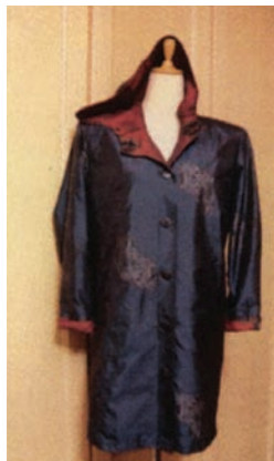
フード付セミロングコート